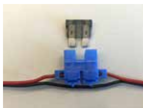
Porte fusible automobile / Automotive fuse holder