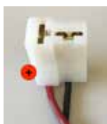
Boîtier mâle / Male housing